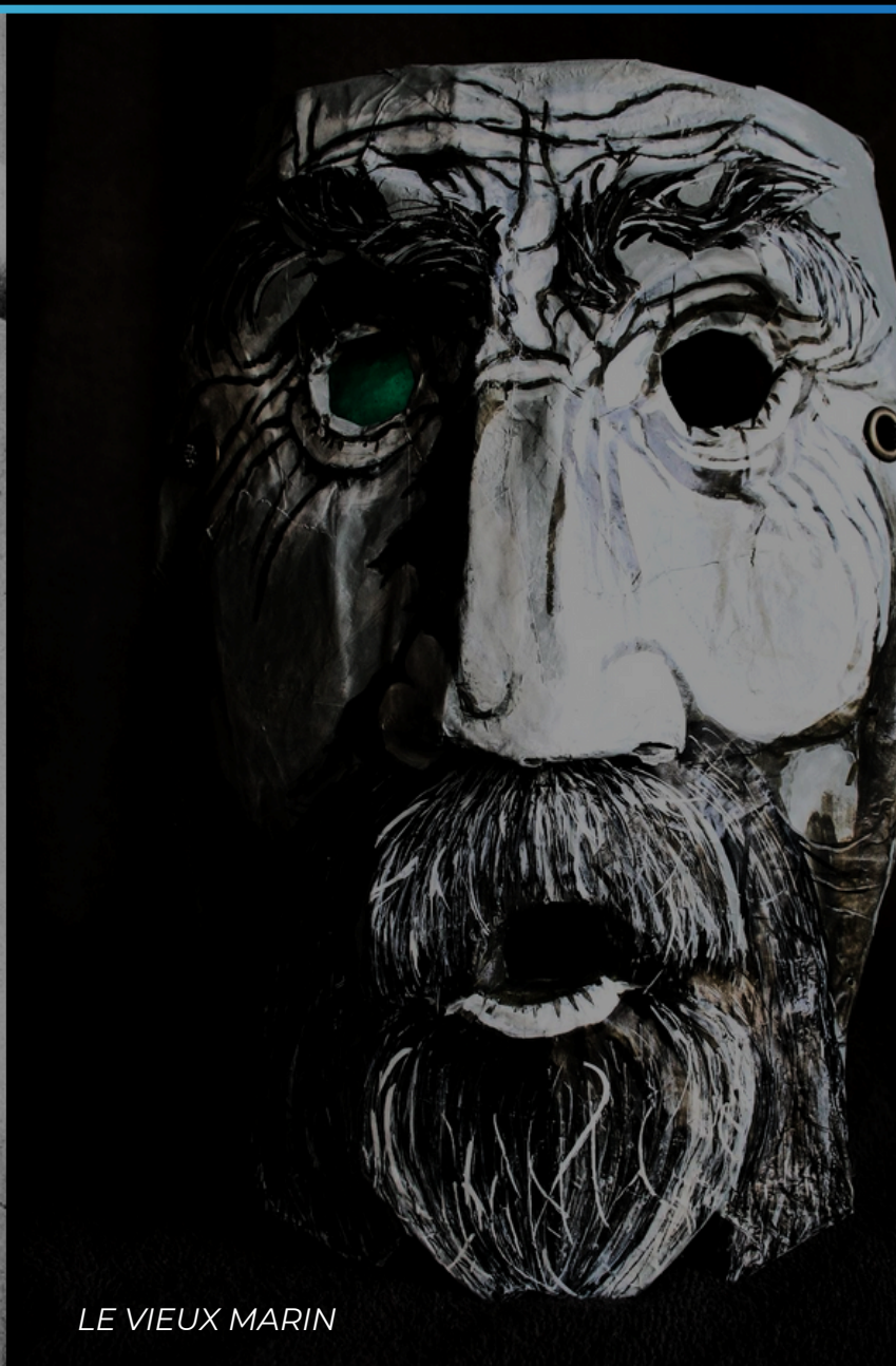
LE VIEUX MARIN